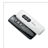
Bedienung Elektrisch / Solar Funk per Handsender