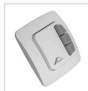
Bedienung für Außenrollladen Elektrisch per Schalter