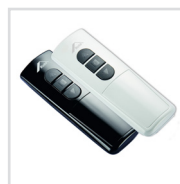
Bedienung für Außenrollladen Elektrisch Funk / Solar Funk per Funkhand-sender